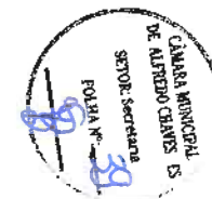
FERNANDO VIDEIRA LAFAYETTE Prefeito Municipal

Alfredo Chaves – ES, 14 de abril de 2022.