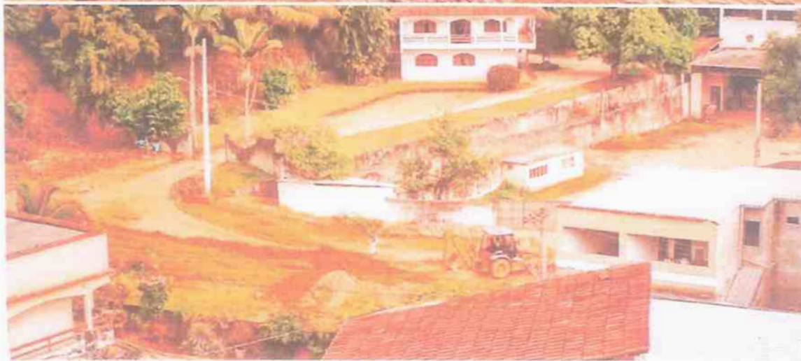
Pavimentação da Rua em frente à Casa Romildo Bettecher