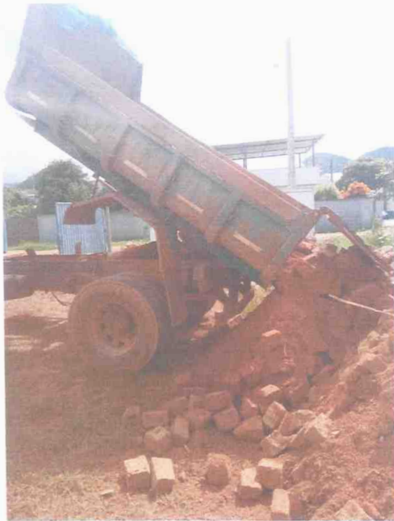
Material depositado no terreno deste Município nas proximidades da ETE – Bairro Santa Rita