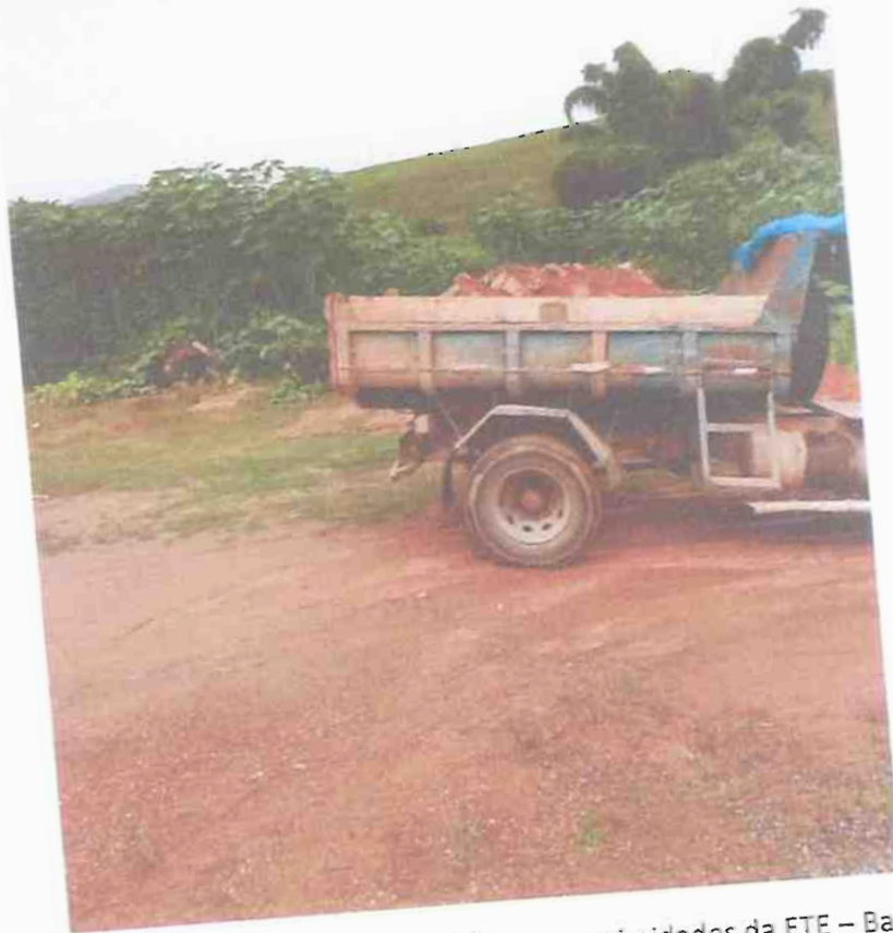
Material depositado no terreno deste Município nas proximidades da ETE – Bairro Santa Rita