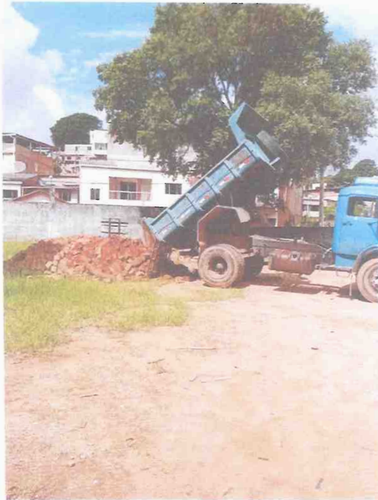
Material depositado na área de Vandeli Costa (antiga garagem), para pavimentação de rua em frente à Casa do senhor Romildo Bettecher