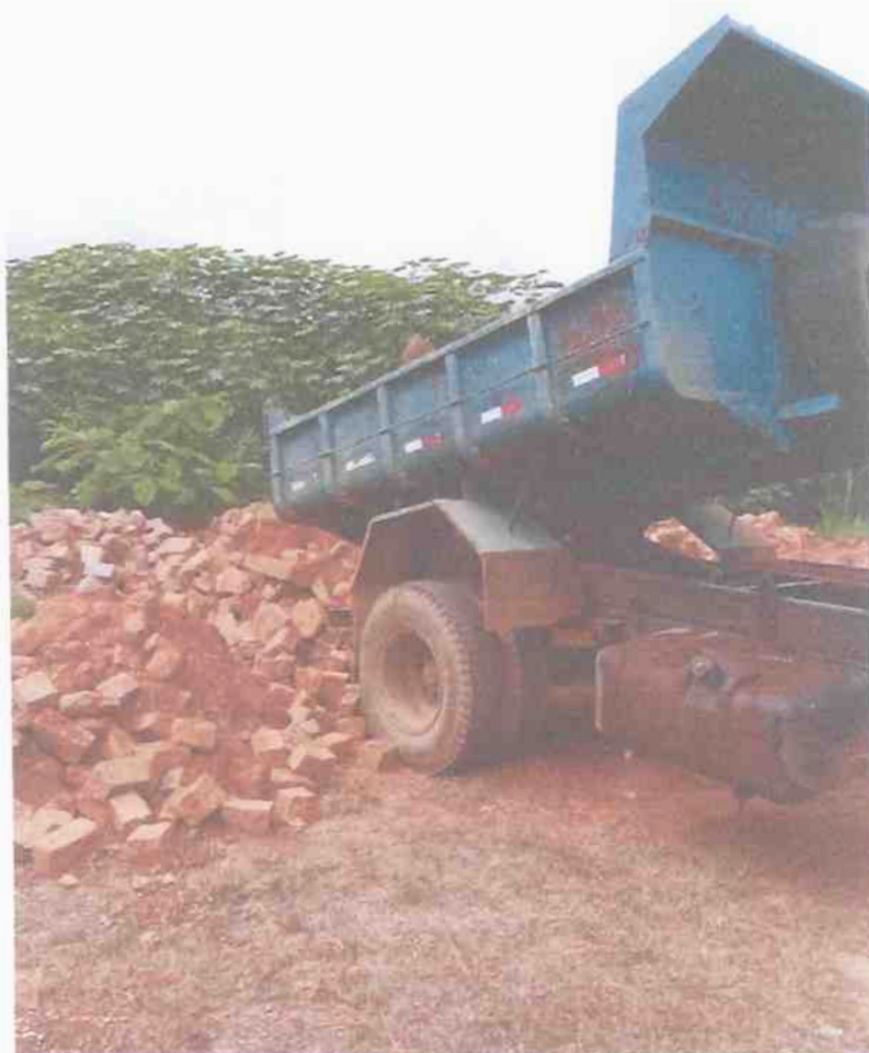
Material depositado no terreno deste Município nas proximidades da ETE – Bairro Santa Rita